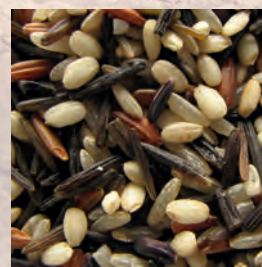
l'umiltà della ricchezza